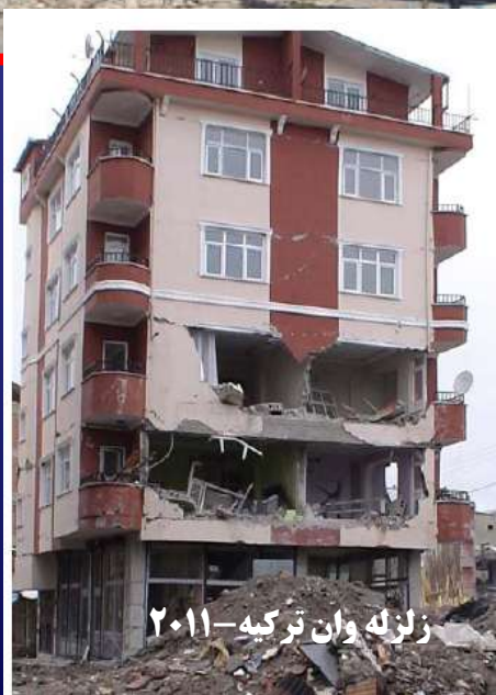
زلزله وان ترکیه-۲۰۱۱