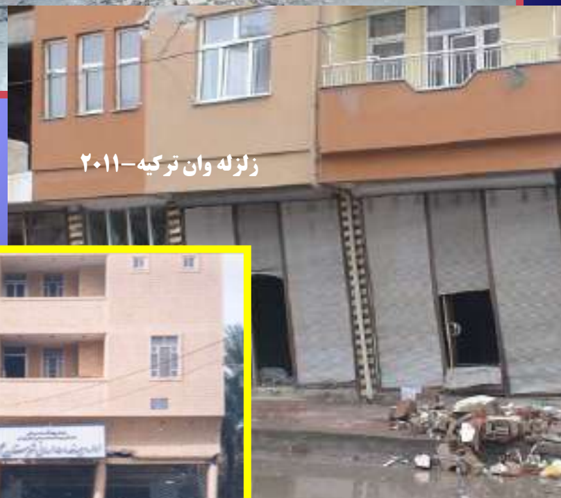
زلزله وان ترکیه-۲۰۱۱